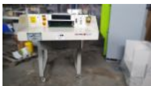
hsm fa 500.2 + taśmociąg wyładowczy